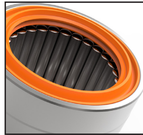
O retentor de nervuras triplas mantém a graxa dentro e as impurezas para fora