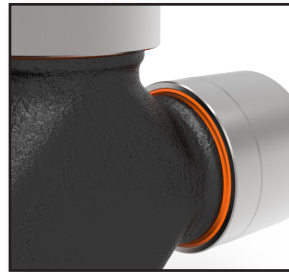
E-kits podem ser reconhecidos pelo retentor laranja