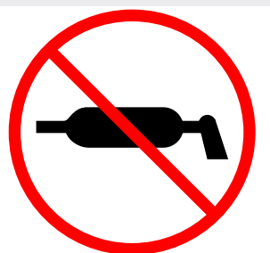
Maintien pas nécessaire