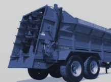
Epandeurs de fumier

Weasler Engineering France 91140, Villebon sur Yvette | France Tel: +33 160 136 846 E-mail: weasler.france@weasler.eu Website: www.weasler.eu