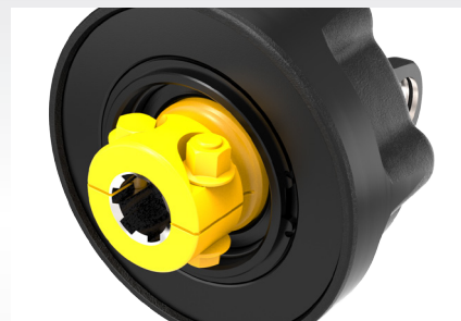
Roue libre intégral